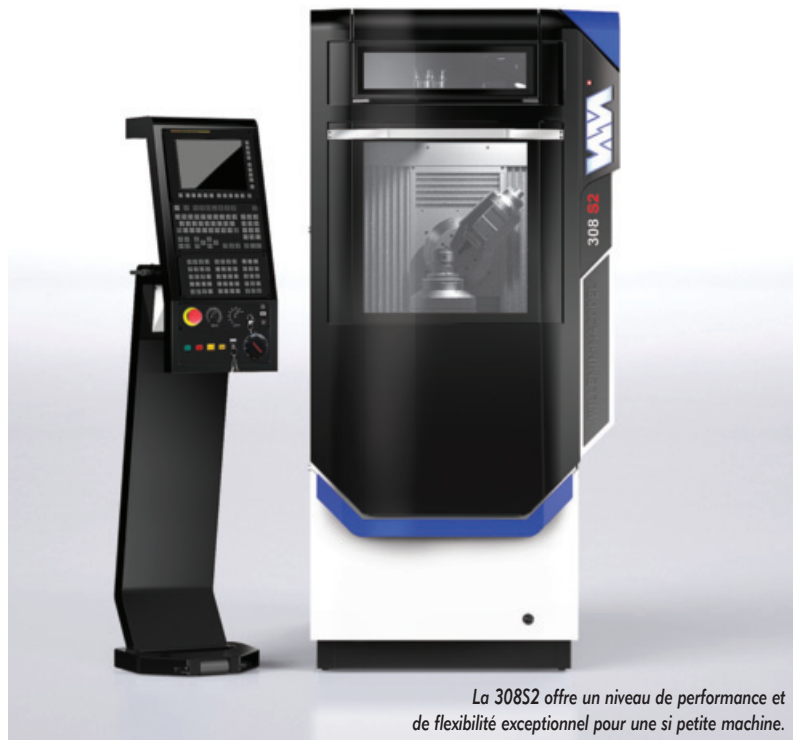
La 308S2 offre un niveau de performance et de flexibilité exceptionnel pour une si petite machine.

Pour assurer que cette nouvelle mouture de la machine 308S s'intègre parfaitement aux exigences du monde de la