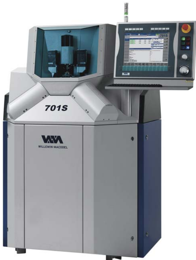
La machine 701S à trois axes dotée d'une cinématique Delta minimise les masses en mouvement, permettant ainsi un travail d'une très haute précision tout en réduisant l'impact environnemental grâce à une très faible consommation d'énergie.

«Ce centre d'usinage permet de réaliser des opérations de tournage, de fraisage et de meulage avec une grande souplesse» précise Denis Jeannerat. La broche de fraisage est dotée d'un changeur d'outils rapide et peut atteindre 42'000 tr/min, mais le véritable avantage de ce centre multi-procédés est le travail simultané à l'avant et à l'arrière de la pièce. Les capacités d'usinage sont identiques des deux côtés. Les gammes opé-