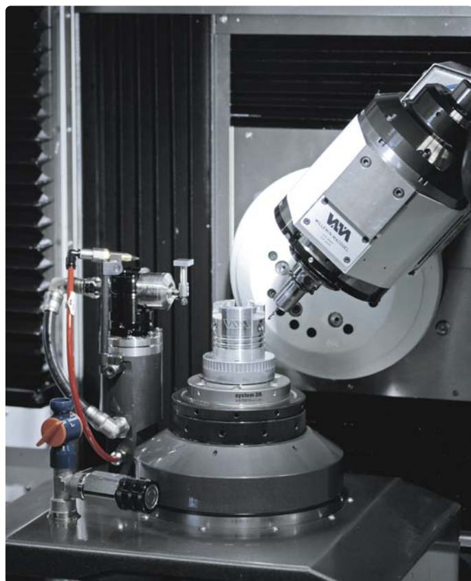
Bien que très compacte, la machine 308S2 offre une zone d'usinage très aérée et largement accessible. L'ergonomie de travail y est particulièrement soignée.